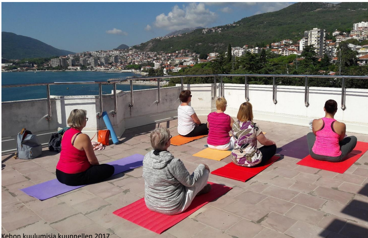
Kehon kuulumisia kuunnellen 2017

HYVÄKSYVÄN VOIMAKIRJOITTAMISEN MATKA MONTENEGROON 21. – 28.9.2019